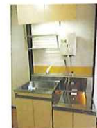
キッチンユニット